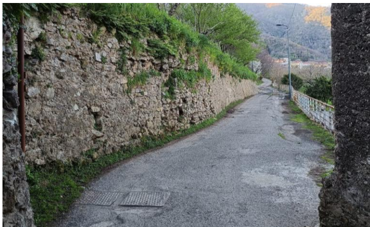
Foto n. 4 Strada oggetto di intervento